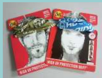
写真は前回のもの。新カラーはグリーン・ピンク系です！！

AG設立5周年ではTシャツと日本手ぬぐい、10周年でもTシャツを作りました。15周年はAGらしく、山で使えるGoodsということでBUFFを作ったところ、非常に人気が高く直ぐに売り切れてしまいました。「是非、もう一度作って！！」とのリクエストにお答えして、20周年記念でもBUFFを作ることになりました。今回は色を変えて、グリーン系、ピンク系の2色。もちろんデザインは、AGオリジナル。夏山、冬山、バックカントリーを問わず、どんな山行にもOK。帽子、ネックウォーマー、バラクラバなど、色々な用途に使えます。値段は¥2,500。(税込)。通販も可能です。送料は¥360。になります。2枚以上のオーダーは送料をサービス。トータルで200枚の限定販売。今回も早い者勝ちです。電話、メールにてお早めにお申込下さい！！