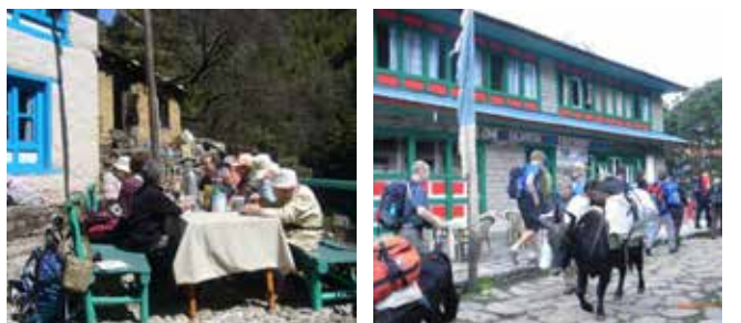
《エベレスト展望ヒマラヤトレッキング10日間》