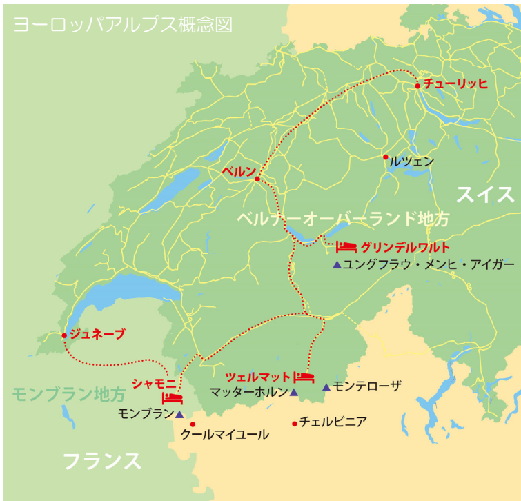
ヨーロッパアルプス概念図